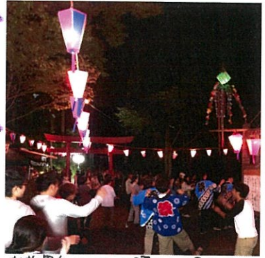
老若男女みんなで踊る！踊る！