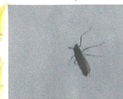
2月の時点で雪虫が出ています。(去年は3月)