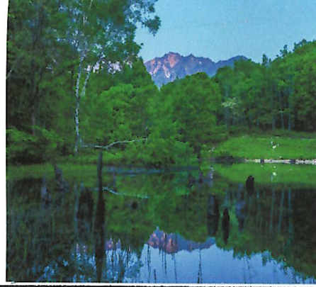
(新緑萌える、早朝の天池)