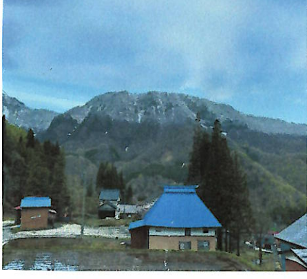
(季節外れの降雪、小赤沢集落より)