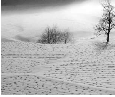
田んぼ一面にできた「雪えくぼ」