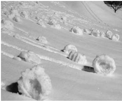
斜面に無数にできた「雪まくり」

これは斜面に落ちた雪玉が、転が りながら湿った雪をくつつけて大き くなったもので、「雪まくり」と言 われる現象です。新雪が5cm程降っ