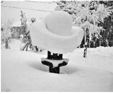
石灯籠にできた帽子のような「冠雪」