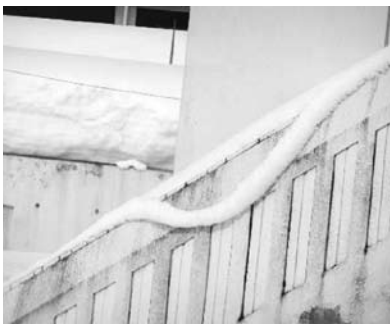
外階段の手すりにできた「雪ひも」