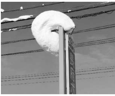
おっと、頭上注意！粘り腰で耐えている看板にできた「冠雪」