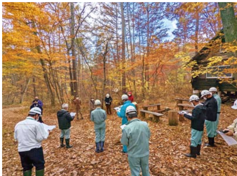
(自家山林内の研修施設前で説明を受ける)

林。標高800mくらいあるが、雪は栄村より少なく、「日本海側の豪雪地帯(ブナ帯)と内陸の少雨地帯の間の中間帯(コナラ・クリ帯)に属し、豊かな植生、多様なパターンの森林が存在」する(荒山林業資料から抜粋)。